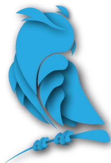
Рис. 1 Оформление рисунков и иллюстраций. Рисунки только в формате .jpg

В основе современных исследований лежат фундаментальные понятия. Эти понятия базируются на нескольких составляющих... [1].